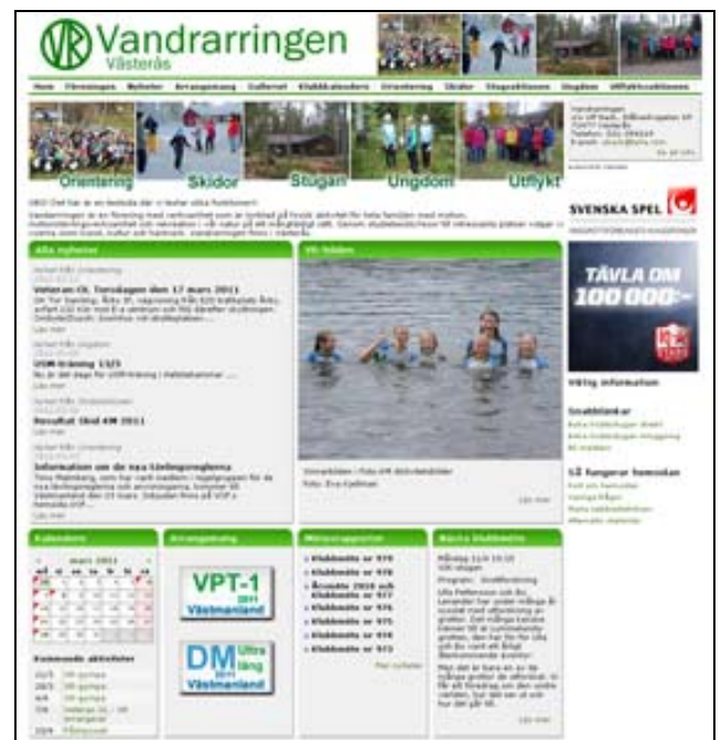
En ögonblicksbild på testsidan 2011-03-20

Det som finns just nu är bl a dagbok, kalender, nyheter, mötesrapporter, gästbok, egna sidor för samtliga sektioner, arrangemangssida, stugbokning, Sidan kommer att premiärvisas på klubbmötet den 13/6. Om ni har sett något extra bra på någon annan klubbs hemsida får ni gärna tipsa om det.