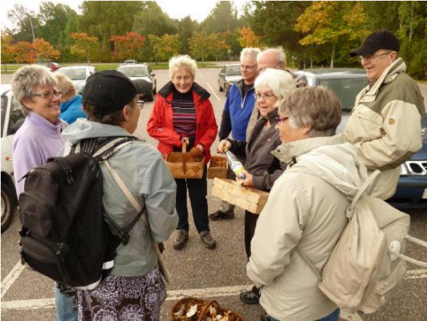
En lyckad skörd

Vi var ett gäng på 10 glada svampletare som använde några timmar den 25/9 2011 för att plocka svamp i skogen bakom Västra sjukhuset.