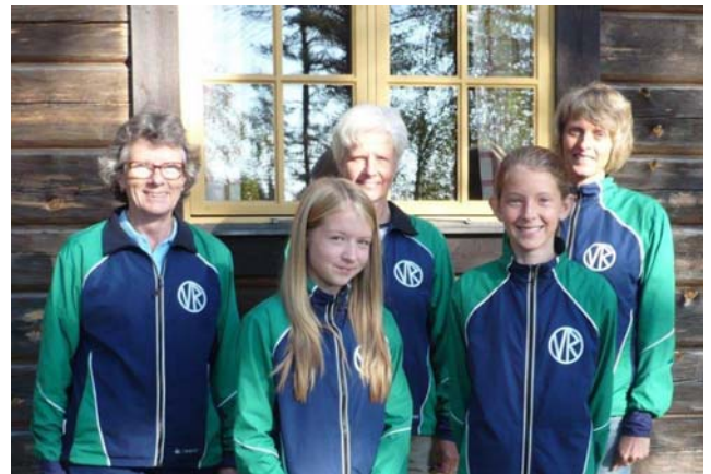
Årets Grand Slam mästare - Foto: Hans Julle

Totalt antal DM-tecken under året blev en fin skörd på 8 segrar i vuxenklasserna. Ungdomarna tog hem 6 guld, 4 silver och 5 brons. Alla dessa fina placeringar gav VR fem Grand Slam Mästare.