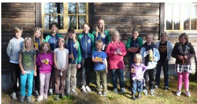
Ungdomarna på Krakendagen